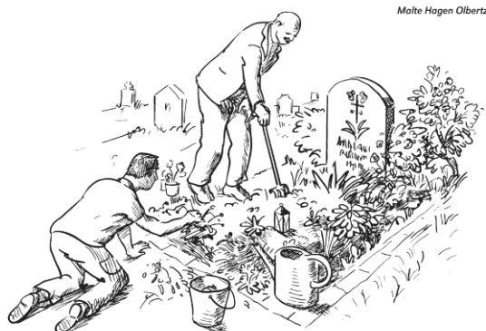
Grabpflege ist auch Seelenpflege. In der liebevollen Gestaltung der letzten Ruhestätte eines Angehörigen blüht die gemeinsame Liebe noch einmal auf.

Am Mittwoch, 20. November (Buß- und Betttag) begeht die KFD St. Josef traditionell ihren Einkehrtag. Beginn ist um 9.30 Uhr mit einem Stehcafé. Ab 10.00 Uhr begleitet uns Pastor Beilicke durch die Veranstaltung, die mit einem geistlichen Impuls und einem kleinen Imbiss gegen Mittag ihren Abschluss findet. Eine Anmeldeleiste wird in der Kirche ausgelegt. Herzliche Einladung!